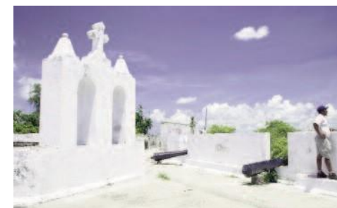
Fort auf Ibo Island