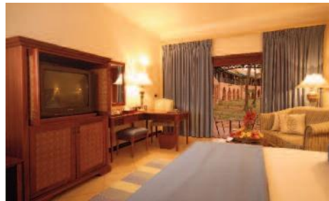
Avani Pemba Courtyard room

Einrichtung: Das Hotel verfügt über total 92 Zimmer (Classic mit Meersicht & Courtyard), sowie 2 Royal Suiten. Alle Unterkünfte sind klimatisiert und haben Bad und/oder Dusche, WC, Safe, TV und Minibar. Inmitten einer gepflegten Gartenlandschaft voller Palmen bietet das Hotel u.a. einen Salzwasser-Pool mit Blick auf Wimbe Beach, kleine Einkaufsläden und Boutiquen, ein Fitness Center, eine Bar, das Quirimbas Restaurant und ein Wellness Spa.