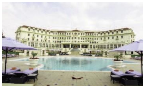
Polana Serena Hotel