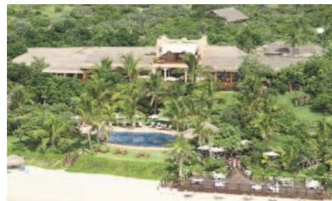
Anantara Bazaruto Island Resort and Spa

Einrichtung: Das luxuriöse Resort verfügt über 30 Beach Chalets (davon ein Honeymoon Chalet) mit Bad, Innen- und Aussendusche, WC, Klimaanlage, Minibar, Safe, Fernseher und eigener Veranda. Für noch höhere Ansprüche gibt es 12 Bayview Villas (mit je 2 Schlafzimmern, Lounge, Sala und kleinem Pool)