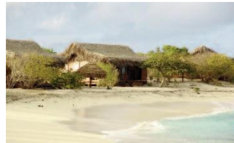
Antanara Medjumbe Chalet

Einrichtung: Medjumbe Island Resort zählt nur 13 klimatisierte Chalets mit Bad, Dusche (innen und aussen) WC und Minibar. Im Hauptgebäude befinden sich die Bar, der Essraum und die Lounge. Angebotene Aktivitäten: Schnorcheln, Tauchen, Schwimmen, Wasserskifahren und vieles mehr.