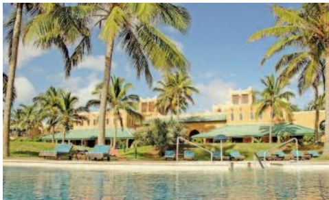
Avani Pemba Beach Hotel & Spa