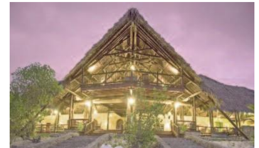
Antanara Medjumbe Island Resort