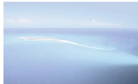
Antanara Medjumbe Island