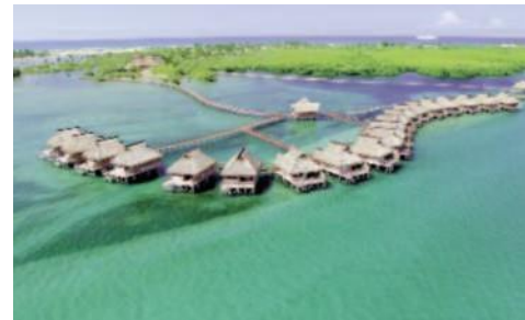
Flamingo Bay Water Lodge

Einrichtung: 20 riedgrasgedeckte Wasserchalets liegen auf Stelzen in einer Bucht von Inhambane. Jedes der geräumigen Chalets ist in warmen Holztönen eingerichtet und verfügt über Klimaanlage, Moskitonetz, grosse Veranda mit Liegestühlen, Sitzecke sowie Dusche/WC. Von jedem Chalet aus führt eine Holzterrasse über eine Holzstiege ins warme Wasser des Indischen Ozeans (Wasserstand ist Gezeitenabhängig); Schwimmen und Schnorcheln vor der Haustüre!