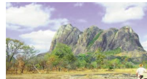
Lugenda Wildlife Reserve