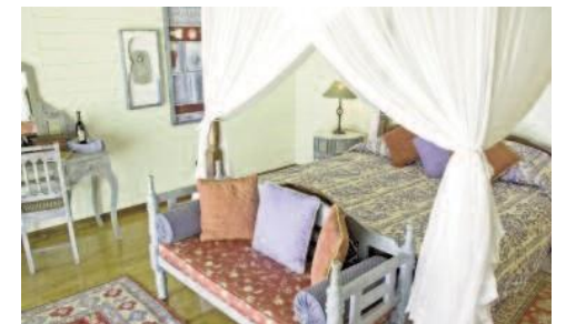
Antanara Medjumbe Chalet