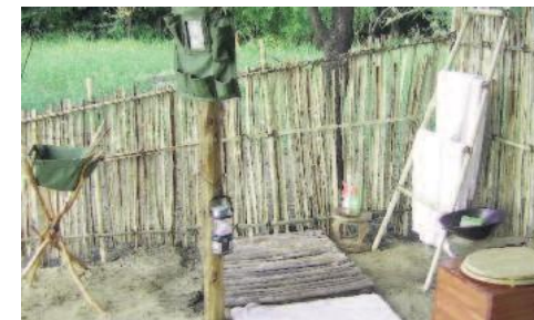
«Badezimmer» Explore Gorongosa

1 Matemo Suite (1 Schlafzimmer, Veranda und Plunge Pool), sowie die Presidential Villa (2 Schlafzimmer, 2 Badezimmer, Bar, Lounge und eigenes Schwimmbad). Zwei ausgezeichnete Restaurants und zwei Bars sind ebenso vorhanden wie ein schönes Schwimmbad (Salzwasser) mit Poolbar. Schöne Erinnerungsstücke werden im Curio-Shop erstanden und für die körperliche und seelische Ertüchtigung können sowohl ein Besuch im Fitnesscenter, wie auch im gepflegten Spa empfohlen werden. Zu den Aktivitäten gehören motorisierte und nicht-motorisierte Wassersportarten wie Tauchen (PADI/NAUI Instruktor vor Ort), Segeln, Schnorcheln, Hochseefischen, Wasserskifahren, Reiten, Inselrundfahrten, Windsurfen und Kayakfahren.