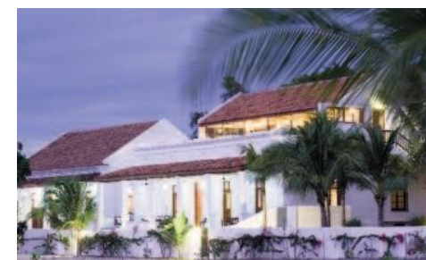
Ibo Island Lodge