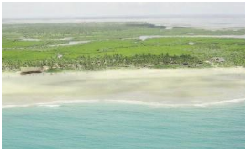
Barra Lodge Luftansicht